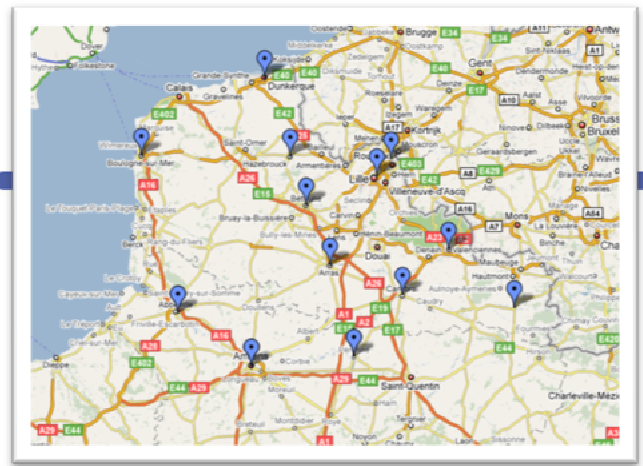
Implantation EUROJURIS dans la région Nord

Cabinet MATON FENAERT VANDAMME WAMBEKE LA MADELEINE (LILLE)