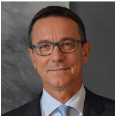
Directeur Scientifique : Manuel BOSQUE - Bosqué & Associés