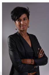
Laëtitia WADIOU MODERE & Associés - ALFORTVILLE