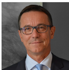
Directeur Scientifique : Manuel BOSQUE - Bosqué & Associés